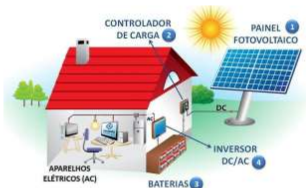
Figura 1: Sistemas de energia solar fotovoltaica e seus componentes.