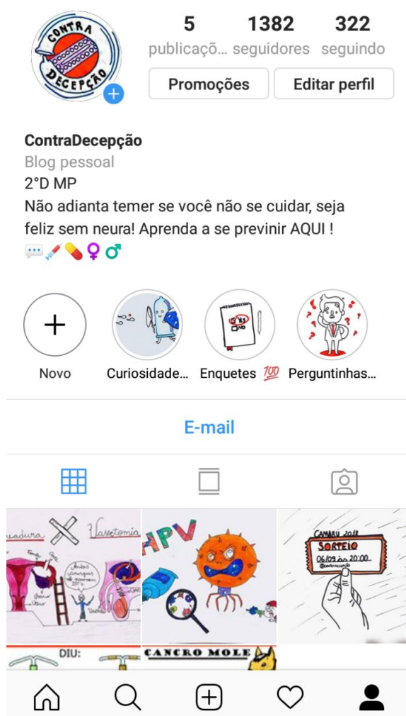
Figura 2: Perfil ContraDecepção.