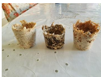
Foto 7: Vasos sustentáveis após a secagem (milho, banana e coco).

Os vasos moldados foram retirados da embalagem, ficando com formato e consistência firmes. A seguir apresenta-se a foto dos três vasos sustentáveis após a secagem, sendo respectivamente de milho, banana e coco (foto 7).