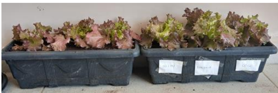
Foto 12: Mudanças de alface, 60 dias após o plantio em recipiente sem SUSTENTFIBRAS (milho, banana e coco) e com o vaso sustentável

O acompanhamento das mudas de alface foi realizado periodicamente, sendo que 60 dias após a plantio das mudas, os alfaces estavam conforme a foto 12.