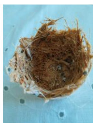
Foto 6: Vaso sustentável após a secagem

Posteriormente, o vaso, foi retirado da embalagem e molde, conforme apresentado na foto 6.