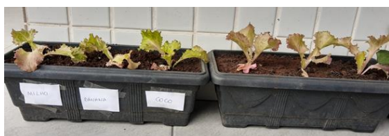
Foto 10: Mudas de alface, 10 dias após o plantio em recipiente com SUSTENTFIBRAS (milho, banana e coco) e sem vaso sustentável (data 22 de junho)

O acompanhamento das mudas de alface foi realizado periodicamente, sendo que 10 dias após a plantio das mudas, os alfaces estavam conforme a foto 10.