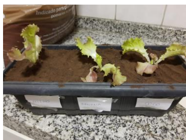
Foto 9: Mudas de alface plantadas em recipiente com SUSTENTFIBRAS (milho, banana e coco)