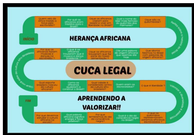
Figura 1: Adaptação baseada no jogo “Cuca Legal”

Na segunda etapa, com base nos dados obtidos pelas pesquisas, foi instituído a ideia da utilização do jogo “Cuca Legal”, reconhecido como jogo de tabuleiro e cartas, que utiliza de matérias e conteúdos do cotidiano com recursos lúdicos voltado à promoção do raciocínio e aprendizagem. No entanto, para fins da abordagem da temática, o jogo foi adaptado, mantendo sua estrutura, mas substituindo os desafios e perguntas por conteúdos culturais, históricos e sociais da herança africana no Brasil. A escolha da adaptação do jogo visa potencializar o alcance da proposta, facilitar sua aplicação no ambiente escolar e a viabilidade do jogo para o público infantil, por ser um material lúdico e objetivo.