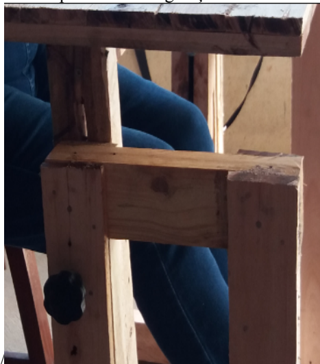
Imagem 2: Dispositivo de Regulação da Altura do Tampo

deixando uma altura mínima (2 cm) entre o tampo e a estrutura de suporte da mesa, evitando “apertar” os dedos ao regular a altura do tampo. A seguir a imagem da estrutura.