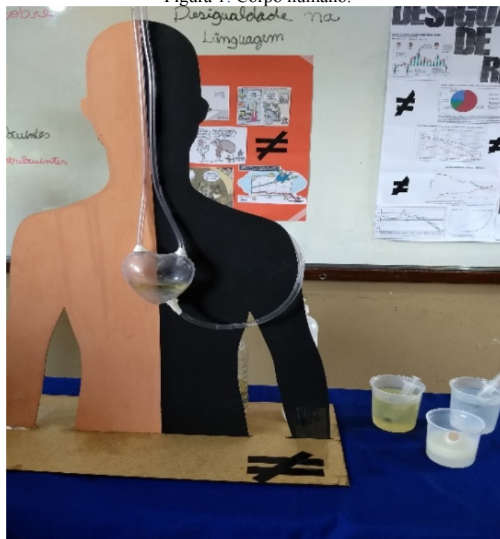
Figura 1: Corpo humano.

Para mostrarmos a desigualdade, decidimos fazer uma maquete em forma de um corpo humano, mostrando o sistema circulatório que é igual em todo ser humano. Injetamos água e óleo que não se misturam (como pobres e ricos) e homogeneizamos a mistura com detergente, simbolizando a igualdade entre os seres humanos. Água, óleo, detergente representam respectivamente: pobres, ricos e a igualdade.