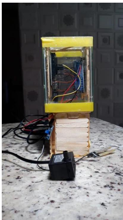
Figura 3: REGARTE pronto para uso.