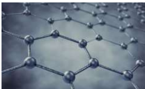
Figura 2: Ilustração do grafeno.