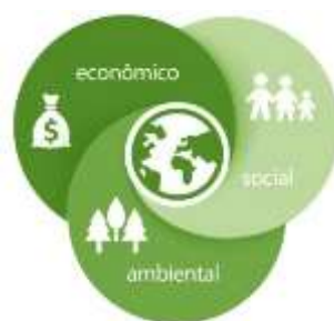
Figura 1: Sustentabilidade e seus aspectos.

Fonte Disponível em: < http://colégioideiaba.com.br/sustentabilidade-um-conceito-mais-amplio-do-que-voce-imagina/ > Acesso em: 23 ago. 2019.