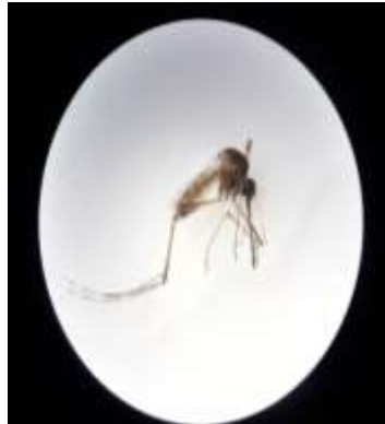
Figura 4: Mosquito amostrado na experiência, além do Aedes aegypti . Provavelmente da família Culicidae.

Foram coletados 28 mosquitos adultos, oito pupas, 15 larvas e mais de 100 ovos dos mosquitos A. aegypti e outro não identificado, mas possivelmente da família Culicidae (Figura 4).