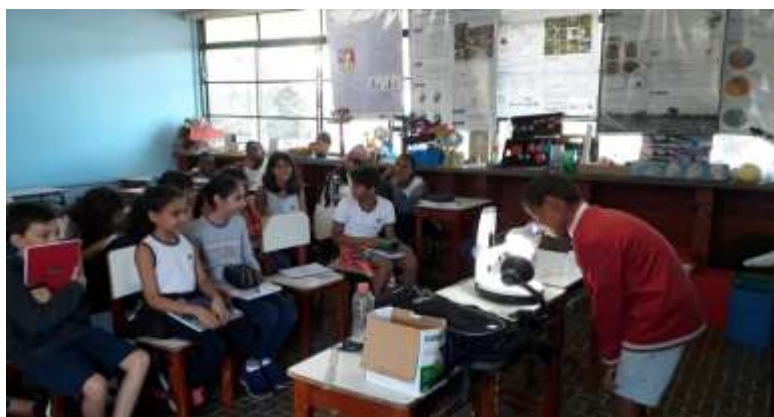
Figura 3: Estudante visualizando em estereomicroscópio os estágios de vida dos mosquitos coletados nas “mosquiteiras”.

Depois de confeccionadas, foram selecionadas pelos professores orientadores as 10 “mosquiteiras” mais bem lacradas e, portanto, com menor risco dos mosquitos saírem após seu desenvolvimento larval. Cinco garrafas (três transparentes e duas verdes) foram colocadas em uma área muito sombreada, em uma das extremidades da escola, e as outras cinco garrafas (três transparentes e duas verdes) foram colocadas na outra extremidade da escola que, embora mais ensolarada, ainda teve as garrafas colocadas em baixo de árvores, ficando também sob a sombra durante boa parte do dia. Todas as garrafas foram colocadas a aproximadamente um metro de distância umas das outras. Depois de colocadas, duas vezes por semana as garrafas foram checadas pelos estudantes e um professor. Esse processo foi feito durante 45 dias, finalizando em abril de 2019. Após as coletas dos mosquitos, eles foram colocados em álcool 70% pelo professor e seus estágios de vida foram vistos por todos os estudantes com o auxílio de um estereomicroscópio no Laboratório de Ensino de Ciências (LEnCi) da EEMCBS (Figura 3).