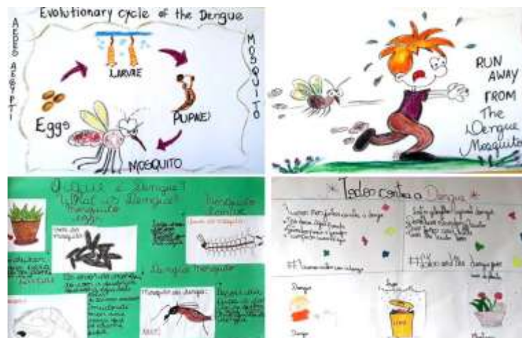
Figura 7: Alguns dos cartazes confeccionados pelos estudantes após a experiência e discussão sobre o tema.