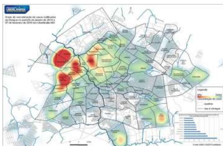
Figura 1: Mapa dos bairros de Uberlândia, mostrando a ocorrência da dengue. Note que os bairros em vermelho são aqueles com a maior concentração de casos, enquanto os bairros em verde representam a menor concentração. A EEMCBS está situada no bairro Saraiva, com baixa concentração de casos durante o período deste estudo.

Segundo os noticiários de Uberlândia, no corrente ano (2019) houve um aumento de 601 para 1300 casos de dengue na cidade, durante uma única semana de fevereiro (TV PARANAÍBA, 2019; Figura 1 mostra os principais bairros afetados em Uberlândia naquele momento). Justamente durante este período de epidemia, no início do ano letivo, foi proposto nas aulas de Ciências e Inglês da Escola Estadual Maria da Conceição Barbosa de Souza (EEMCBS) conscientizar os estudantes dos sextos anos do Ensino Fundamental II quanto a este tema. Para tanto, os estudantes analisaram o ciclo de vida dos mosquitos, montaram uma armadilha para capturá-los e conhecer os seus estágios de vida e, finalmente, prepararam cartazes bilíngues para elucidar a experiência vivida e aprenderem que o inglês é a língua universal da ciência.