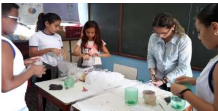
Figura 2: Estudantes preparando as “mosquiteiras” com material de baixo custo e sob a supervisão dos professores no LEnCi.

Depois de confeccionadas, foram selecionadas pelos professores orientadores as 10 “mosquiteiras” mais bem lacradas e, portanto, com menor risco dos mosquitos saírem após seu desenvolvimento larval. Cinco garrafas (três transparentes e duas verdes) foram colocadas em uma área muito sombreada, em uma das extremidades da escola, e as outras cinco garrafas (três transparentes e duas verdes) foram colocadas na outra extremidade da escola que, embora mais ensolarada, ainda teve as garrafas colocadas em baixo de árvores, ficando também sob a sombra durante boa parte do dia. Todas as garrafas foram colocadas a aproximadamente um metro de distância umas das outras. Depois de colocadas, duas vezes por semana as garrafas foram checadas pelos estudantes e um professor. Esse processo foi feito durante 45 dias, finalizando em abril de 2019. Após as coletas dos mosquitos, eles foram colocados em álcool 70% pelo professor e seus estágios de vida foram vistos por todos os estudantes com o auxílio de um estereomicroscópio no Laboratório de Ensino de Ciências (LEnCi) da EEMCBS (Figura 3).