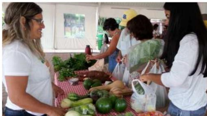
Figura 2: Feira Solidária.

realização de questionário a ser aplicado aos consumidores. Etapa a qual ainda não foi possível devido a questões de saúde relacionadas ao isolamento no período de pandemia.