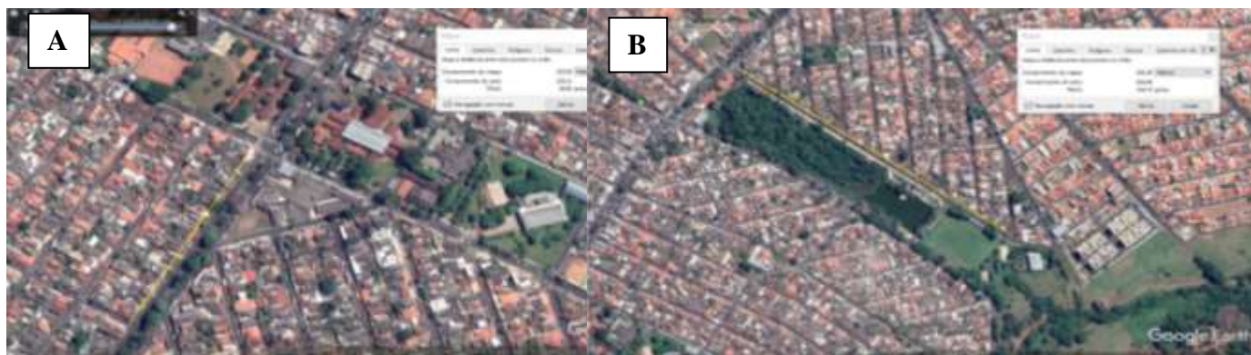
Figura 1: Quarteirões do bairro Luizote de Freitas selecionados para protótipo

O projeto que será apresentado no dia da Feira Ciência Viva trata-se de um protótipo que representará dois quarteirões do bairro Luizote escolhidos através do site Google Maps (GOOGLE, 2019) para testar nossas previsões. Um dos quarteirões é um quarteirão residencial ao lado da Escola Estadual Professor Leônidas de Castro Serra (Figura 1 A). E o outro o quarteirão do Parque Municipal Luizote de Freitas (Figura 1 B).