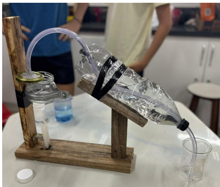
Foto 1: Destilador simples montado com materiais recicláveis.